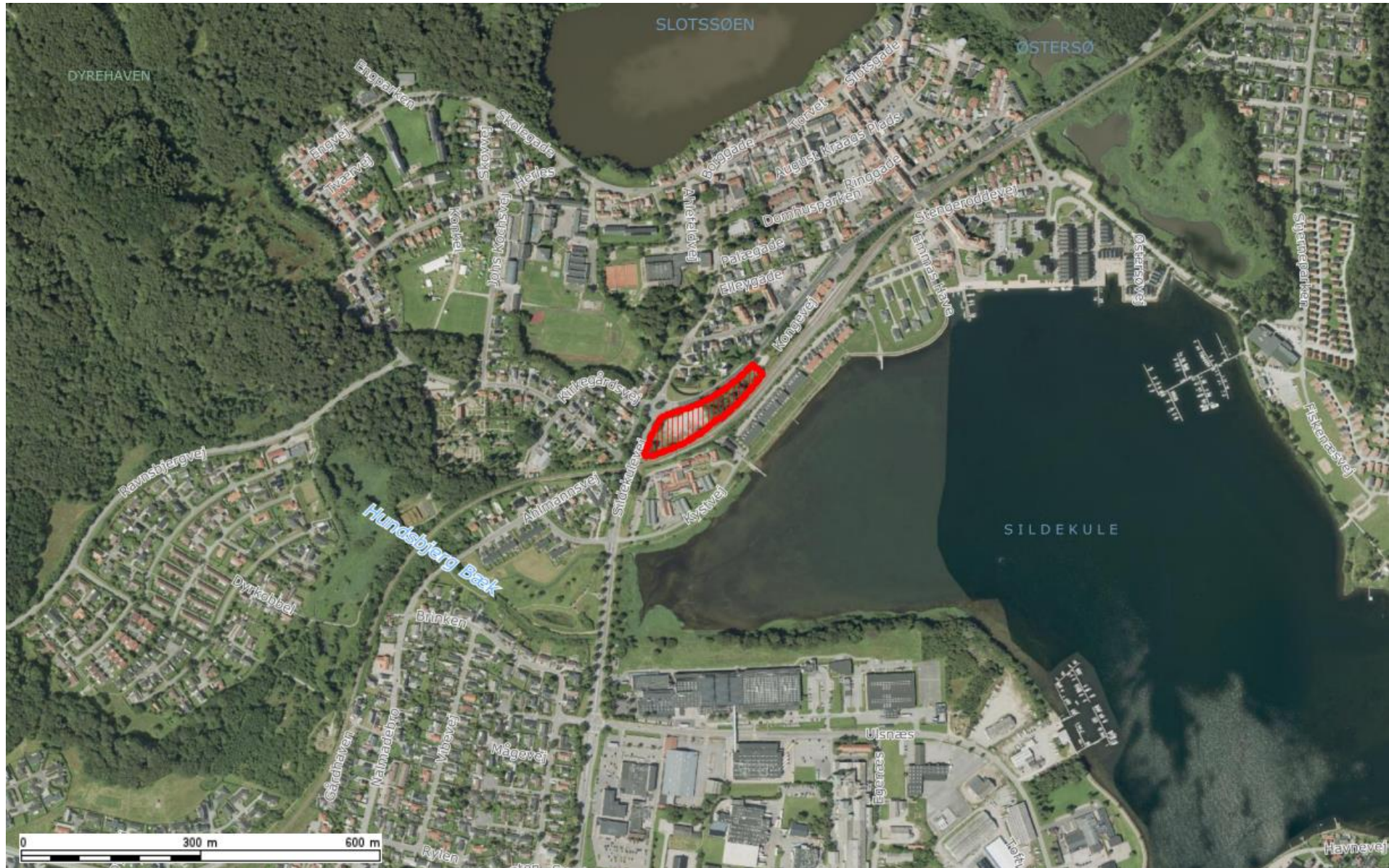
Projektområdets placering, set i forhold til Gråsten, er vist herover med rød markering.