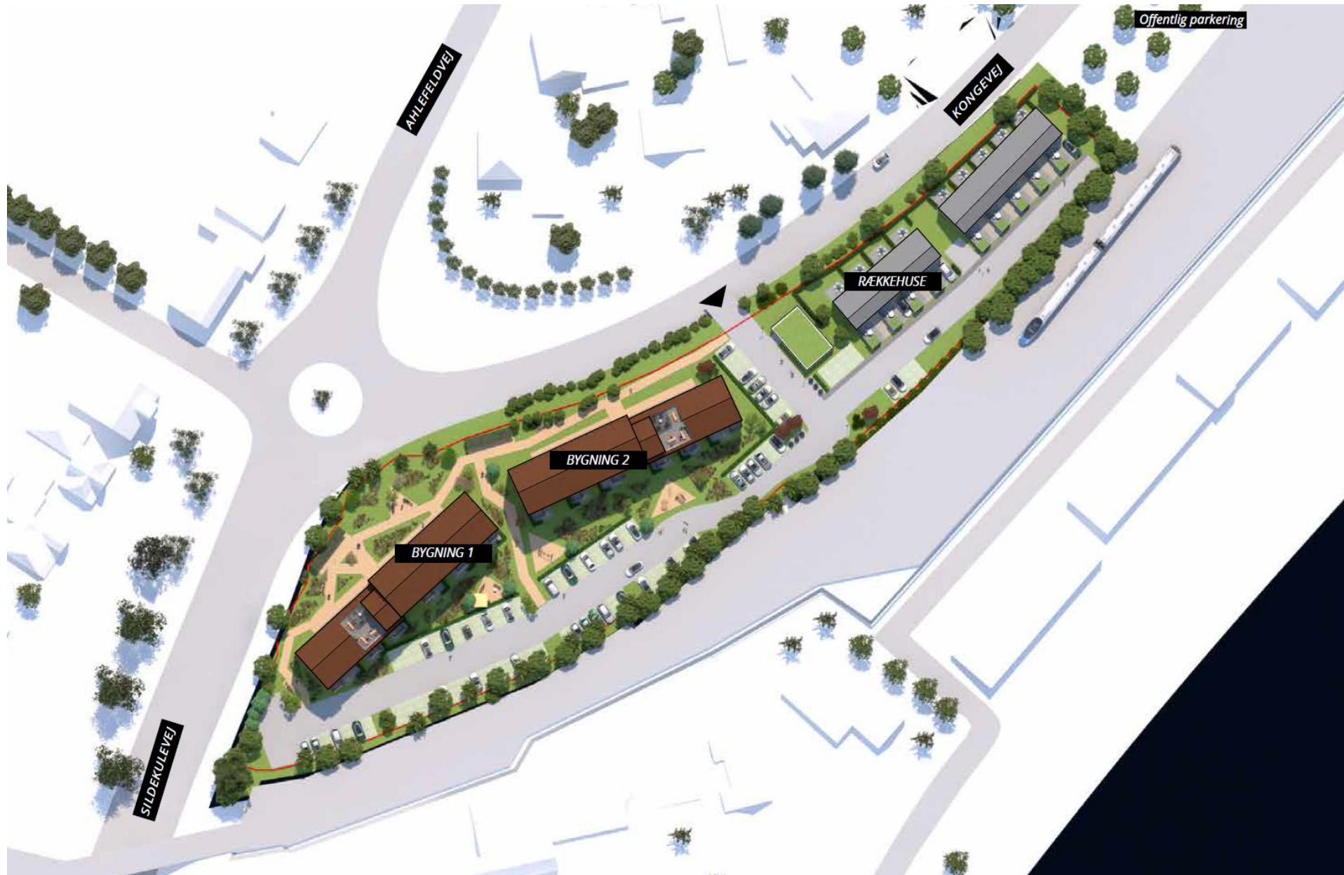
Herover ses en situationsplan af det ansøgte projekt.