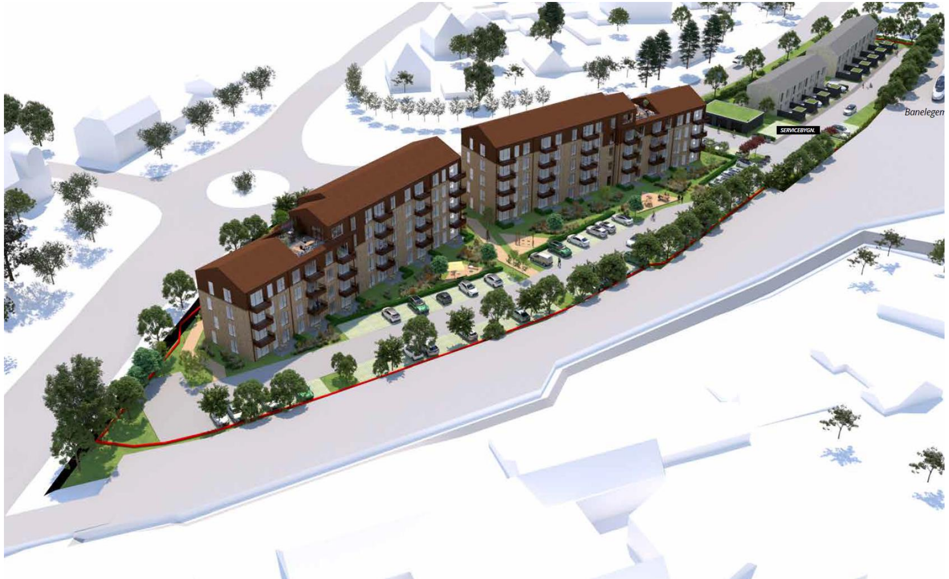
Herover ses en visualisering af det ansøgte projekt.