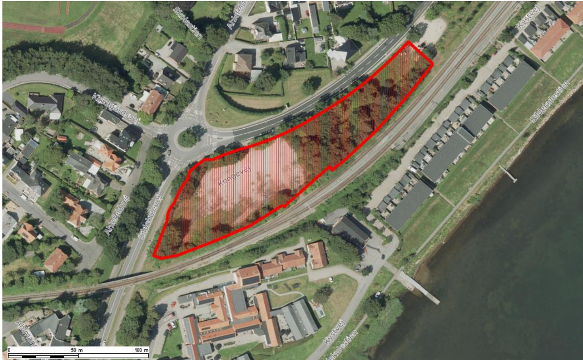
Herover ses forslaget til lokalplanafgrænsningen, med forbehold for eventuelt, mindre justeringer. Området ligger i den sydlige-centrale del af Gråsten.