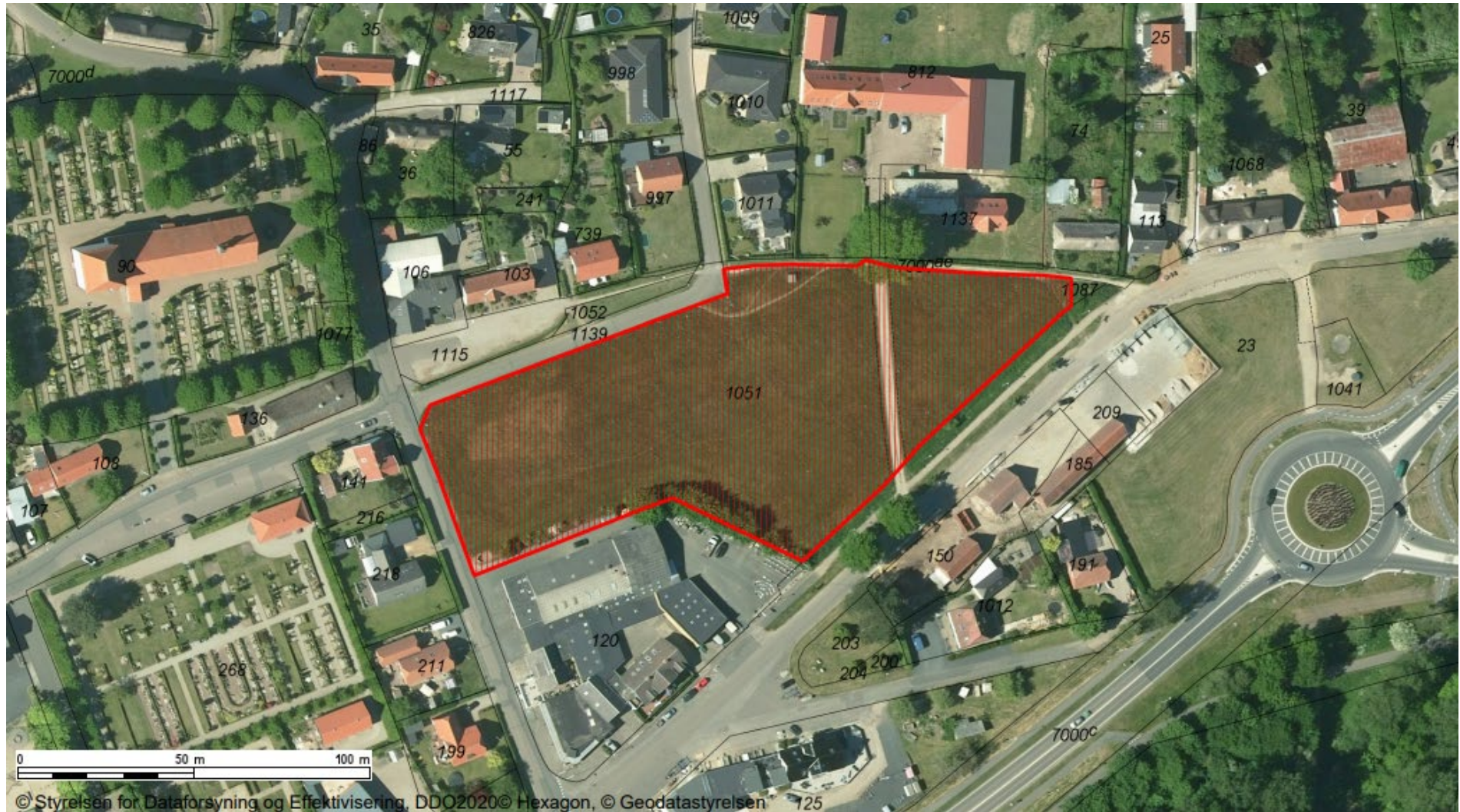
Projektområdets afgrænsning og placering ved Østerkirkevej i Sønderborg.