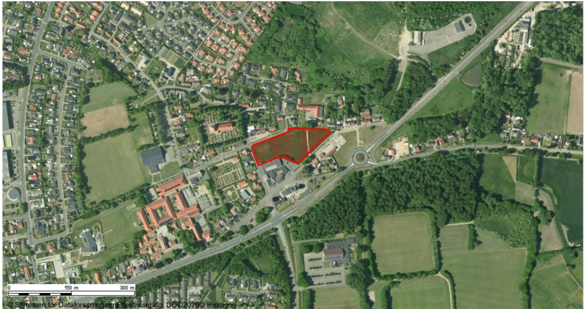
Projektområdets afgrænsning og placering i forhold til Sønderborg by.