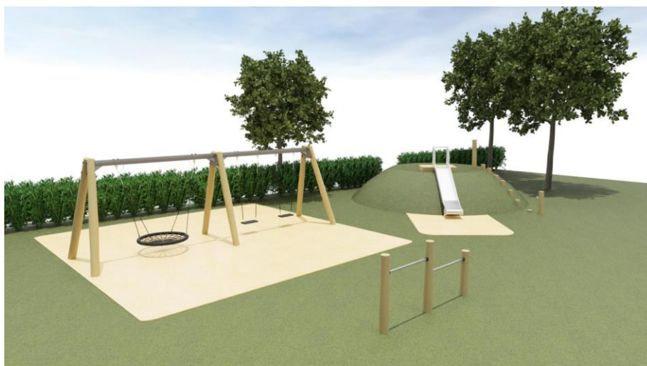
Illustration af ønskede legeredskaber fra ansøgningen.