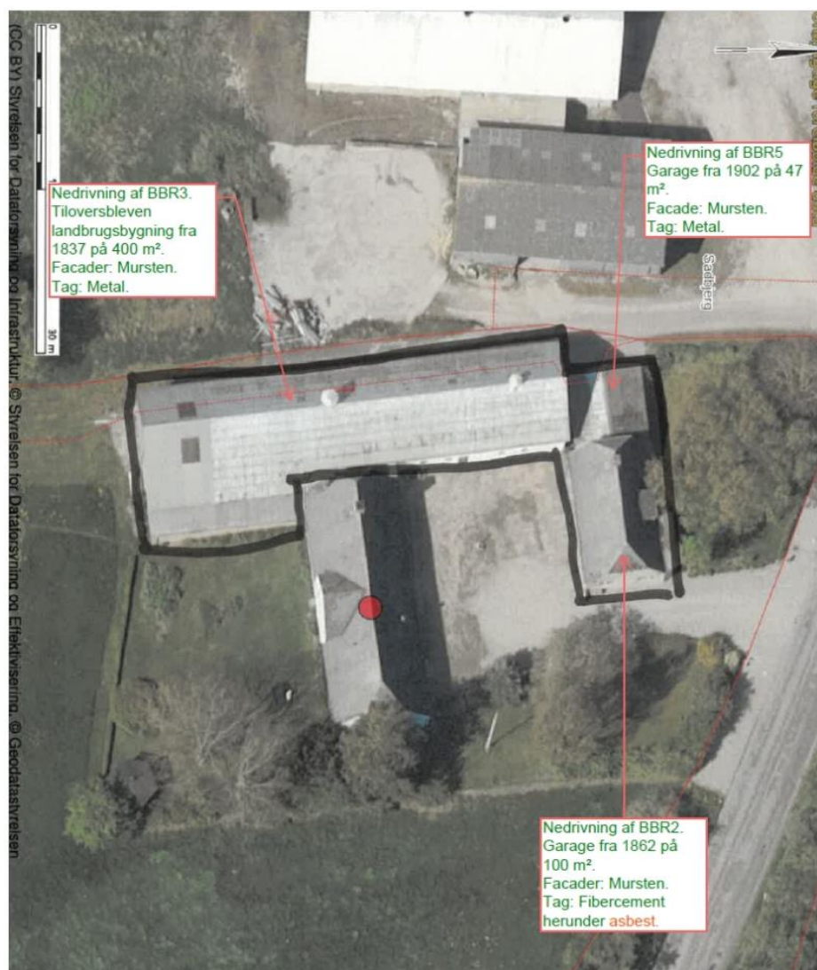
Situationsplan som viser de bygninger som rives ned, hvor der er søgt bevaring af byggeret på.