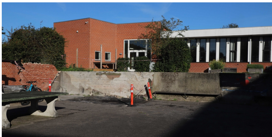
Foto af det sted, hvor garagen har stået og containerne skal placeres.

Stålcontainerne placeres i tilknytning til den samlede bebyggelse, og er en del af skolens gårdsplads.