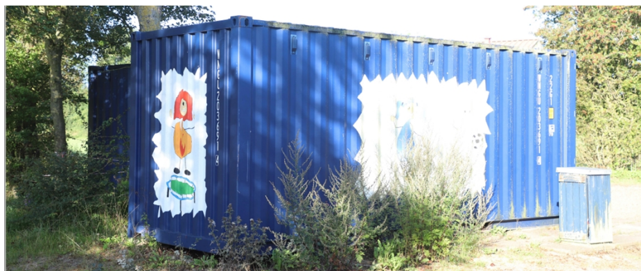
Modelbillede af containere.