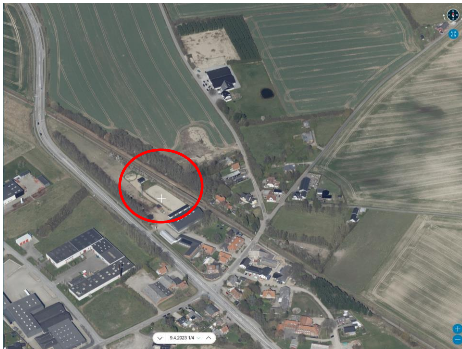
Luffoto fra 2023 som viser placering af roundpen og placering af ridebane.