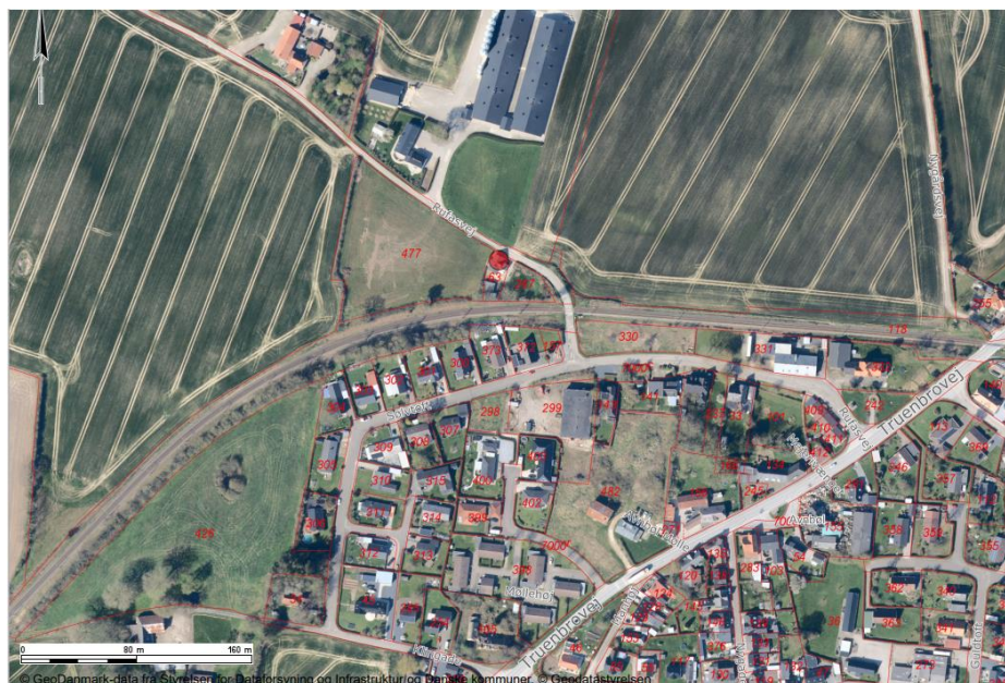
Oversigtskort som viser ejendommens placering på matr.nr. 63, Avnbøl, Ullerup.

Du har søgt om tilladelse til at opføre shelter på 6 m 2 , på ejendommen som ligger på adressen Rufasvej 11, 6400 Sønderborg.