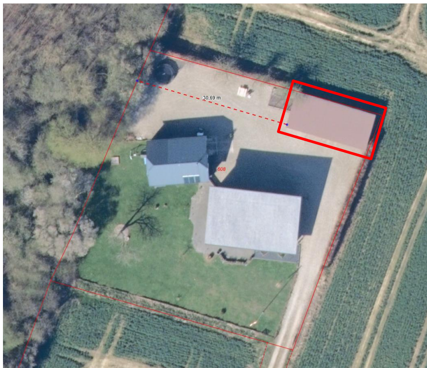
Situationsplan som viser det ansøgte projekt. Garage markeret med rødt.