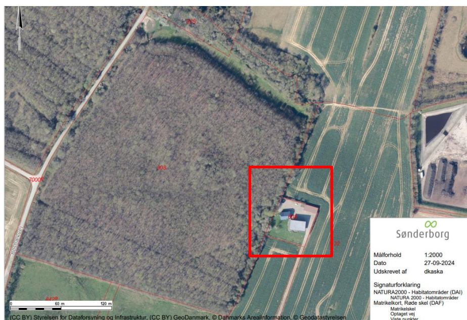
Oversigtskort som viser ejendommens placering på matr.nr. 608, Skodsbøl, Broager.

Du har søgt om tilladelse til lovliggørelse af tilbygning til garage på 17 m 2 , på ejendommen som ligger på adressen Skodsbølvej 106, Skodsbøl, 6310 Broager.