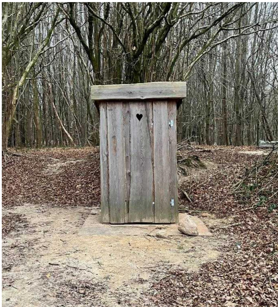
Foto af muldtoiletet fra ansøgningen.