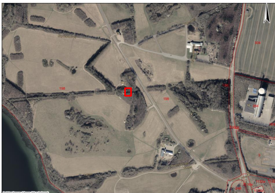
Oversigtskort som viser ejendommen – matr.nr. 198, Kær, Ulkebøl. Muldtoilet er opført i den røde firkant.

I har søgt om landzonetilladelse til lovliggørelse af muldtoilet ved bålhytte, som ligger ved Skydebanevej 3A, Kær, 6400 Sønderborg.