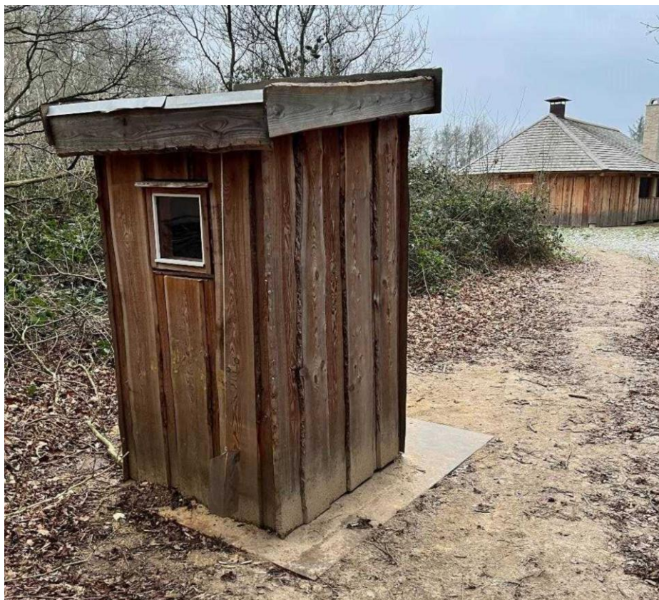
Foto af muldtoiletet fra ansøgningen.