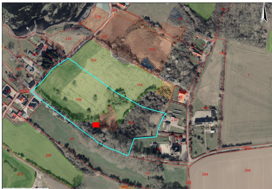
Oversigtskort som viser ejendommen med placering af læskur på matr.nr. 109, Iller, Broager.

Du har søgt om landzonetilladelse til at opføre et læskur til heste på 15 m 2 på matr.nr. 109, Iller, Broager.