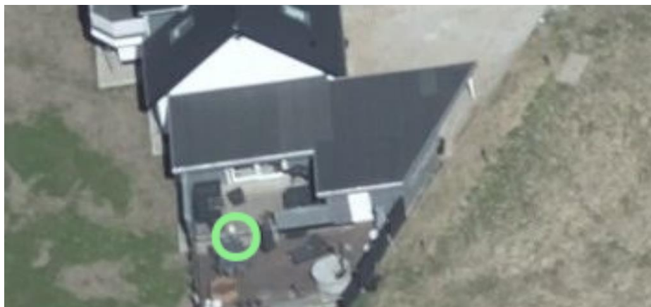
Solceller placeres på den flade del af tagarealet.

Du skal være opmærksom på, at denne afgørelse kun er givet i forhold til planloven.