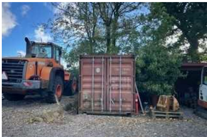
Foto som viser containeren.