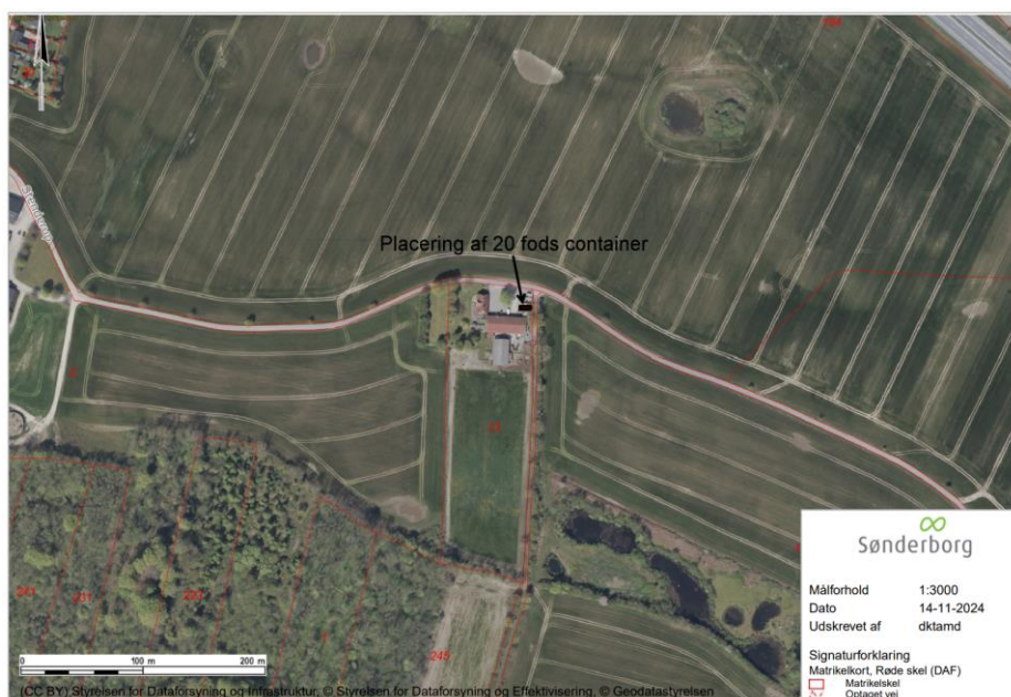
Oversigtskort som viser ejendommen – matr.nr. 13, Stenderup, Nybøl.

Du har søgt om landzonetilladelse til lovliggørelse af 20 fods container, på ejendommen som ligger på adressen Stenderup 21, 6400 Sønderborg.