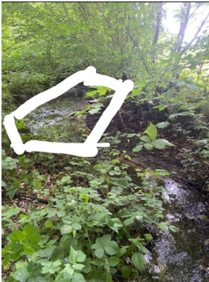
Figur 2. Fra ansøgningsmaterialet. Med hvidt er sandfangets placering groft skitseret. Drænrøret med fremtidigt udløb i sandfanget kan ses.

Sønderborg Kommune begrundes tilladelsen med, at reguleringen vil forbedre vandløbets fysiske variation og derved levevilkår for smådyr og fisk.