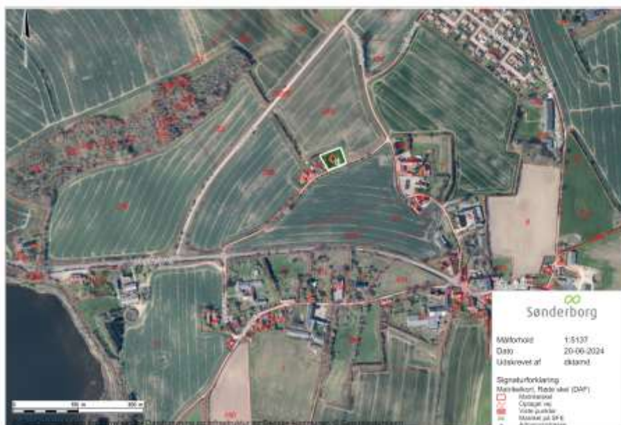
Oversigtskort som viser matr.nr 4 Brandsbøl, Havnbjergs placering.

Du har søgt om tilladelse til at opføre en garage på 96 m 2 , på ejendommen som ligger på adressen Tværballe 11, Brandsbøl, 6430 Nordborg.