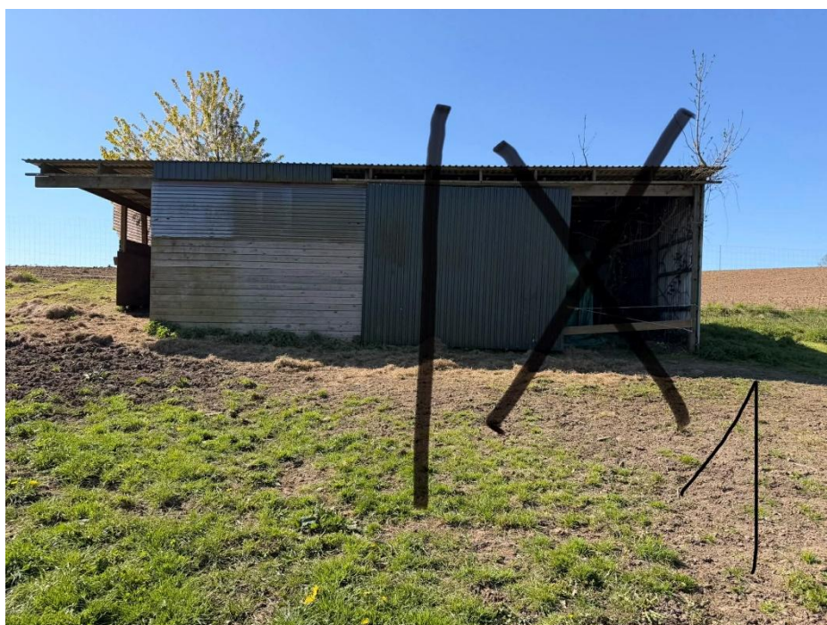
Foto af det opførte læskur til heste – Den del markeret med sort kryds fjernes.

På baggrund af dialogen med ejer er det aftalt, at læskuret reduceres til 35 m 2 .