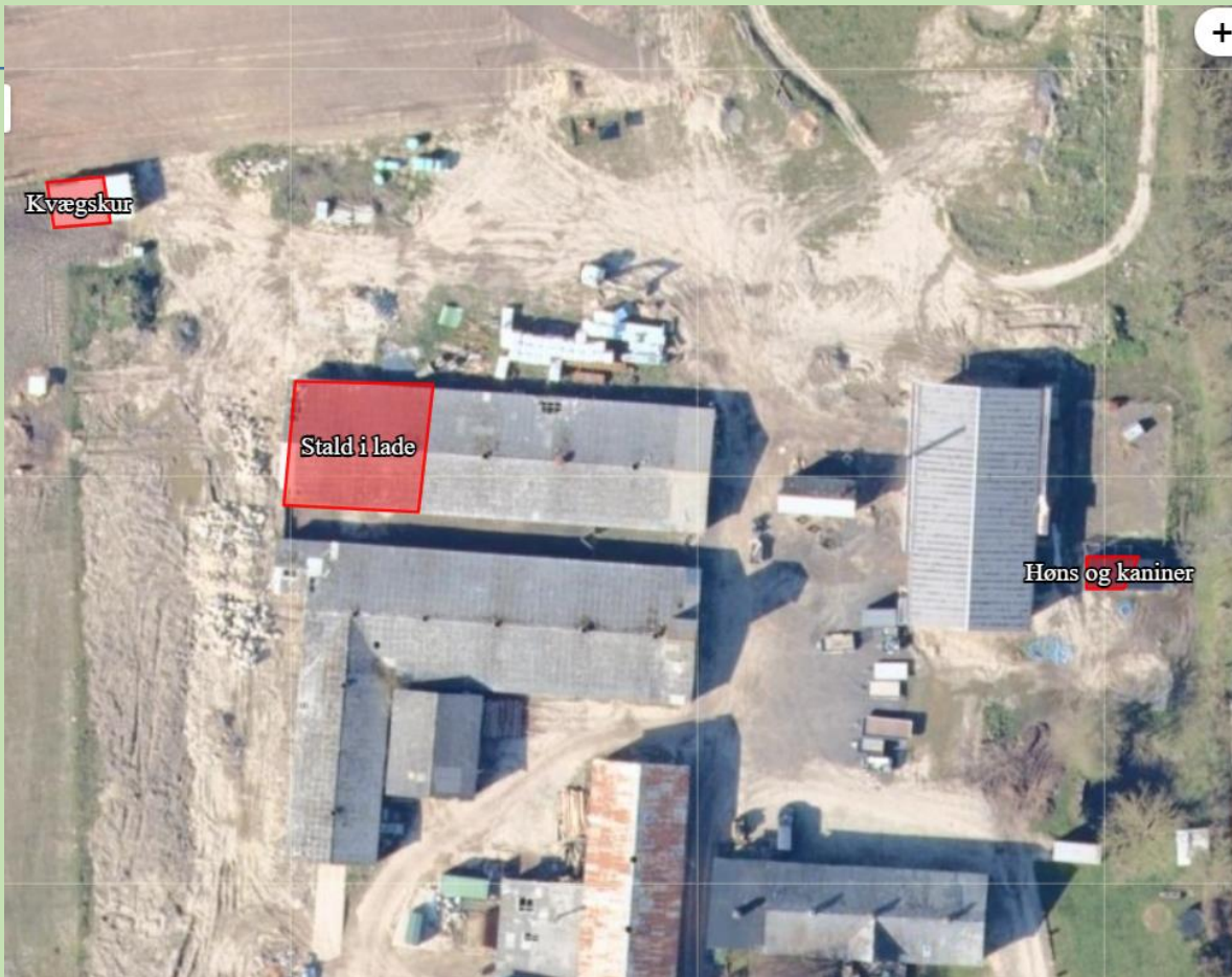
Figur A. Oversigt over ejendommens produktionsanlæg