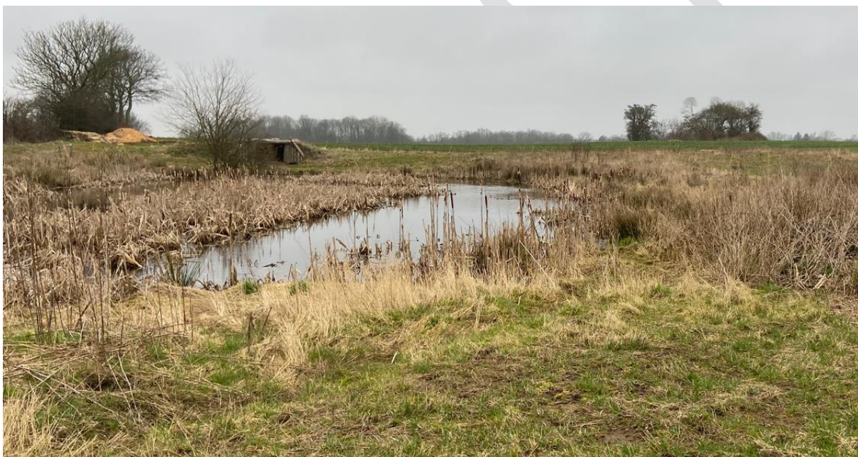
Figur 3. Oversigtskort over sø og fåreskjul

Sønderborg Kommune vurderer, på baggrund af ovenstående, at ansøgningen overholder alle krav i forhold til påvirkning af kategori 1, 2 og 3 natur, ligesom det vurderes, at der ikke vil ske en tilstandsændring af naturområder, der er beskyttet af naturbeskyttelseslovens § 3. Ligeledes vurderes det, at projektet ikke medfører ændringer, der påvirker eventuelle bilag IV-arter eller deres levesteder væsentligt.