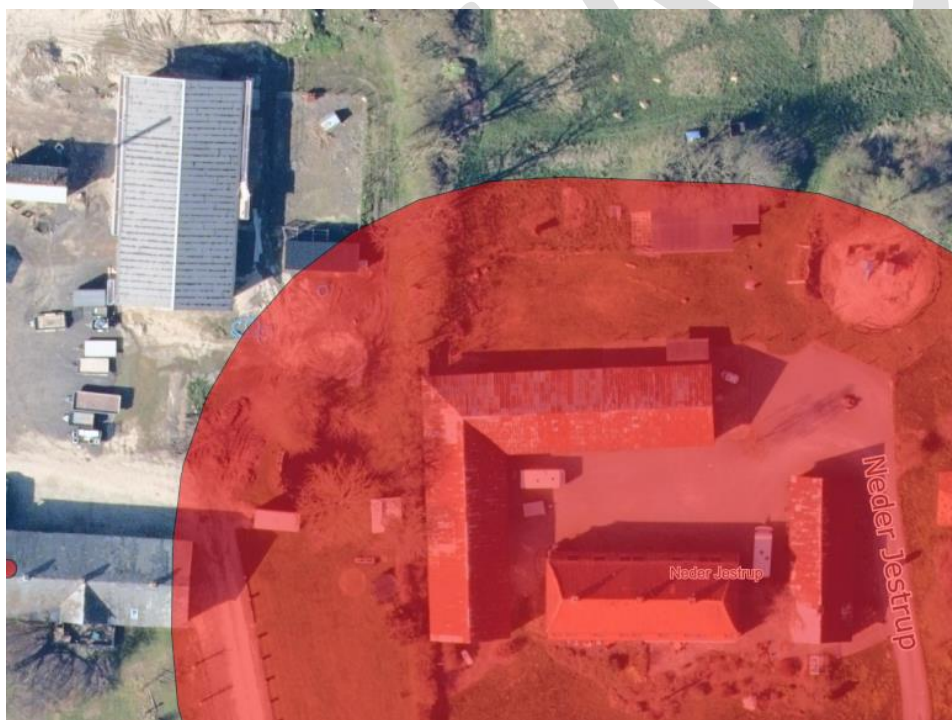
Figur 4. Oversigtskort over forbudszone for dyrehold i forhold afstandskrav på 50 m til Neder Jestrup 6 og 8 (rød)

Afstandskravene fra stalde til vandløb (herunder dræn) og søer større end 100 m 2 , offentlig vej og privat fællesvej samt beboelse på samme ejendom er 15 m - afstandskravene til vandforsyningsanlæg, der ikke er til almen vandforsyning og til levnedsmiddelvirksomhed er på 25 m - afstandskrav til naboskel er på 30 m og afstandskrav til vandforsyningsanlæg til almen vandforsyning og nærmeste nabobeboelse er på 50 m.