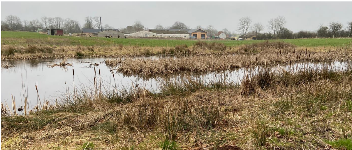
Figur 2. Sø syd for fåreskjul