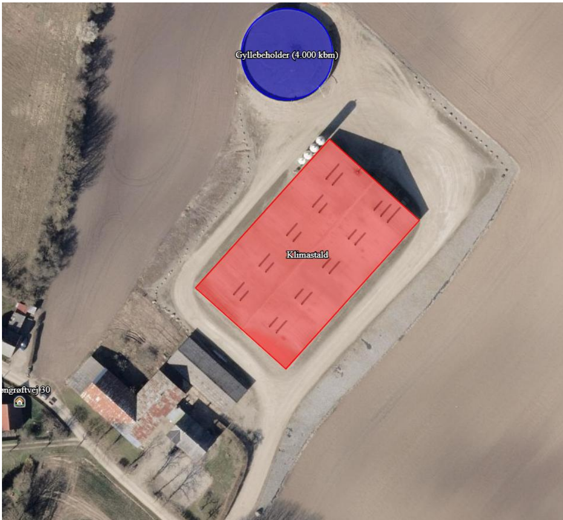
Figur 1. Oversigtskort over produktionsarealer (rød) og gødningsopbevaringsanlæg (blå)