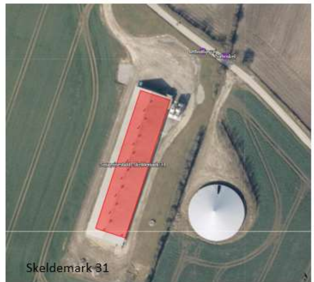
Figur 1. Oversigtskort over produktionsarealer (rød) og gødningsopbevaringsanlæg (blå)