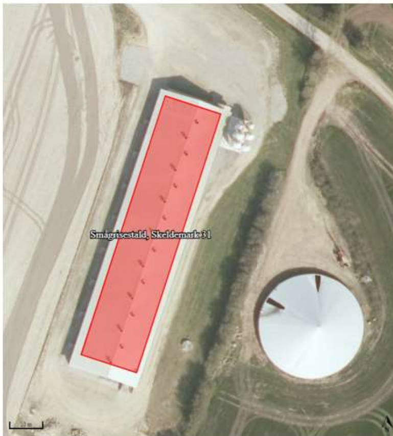
Figur 2: Husdyrbrugets stald ved Skeldemark 31.