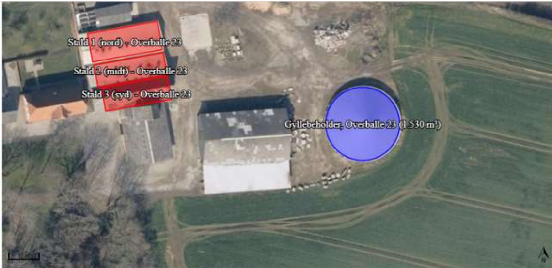
Figur 1: Husdyrbrugets stalde og opbevaringsanlæg til husdyrgødning ved Overballe 23.