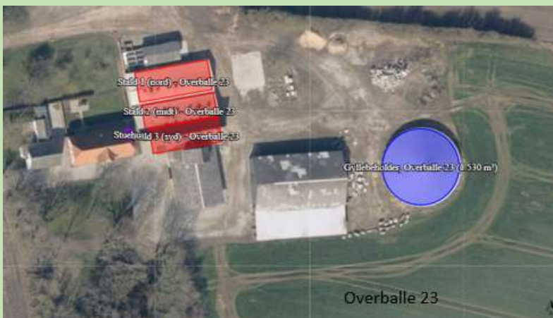
Figur A. Oversigt over ejendommens produktionsanlæg