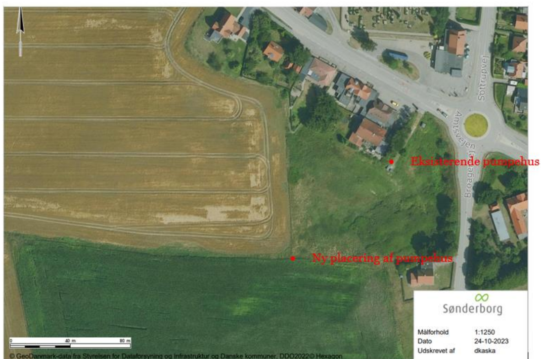
Figur 2 Kort med ny placering af pumpehus.

Udover etablering af bassinet skal den eksisterende pumpestation flyttes tættere på bassinet, se Figur 2 herunder. Pumpehuset kommer til at have samme størrelse som det nuværende: H: 1 m, B: 2 m, L: 2,5 m.