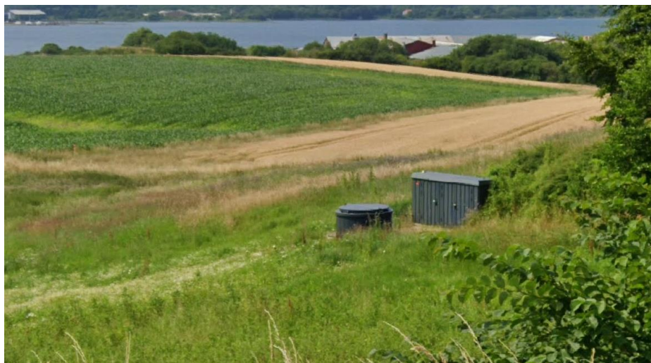
Figur 3 Foto af eksisterende pumpehus og teknikskab.