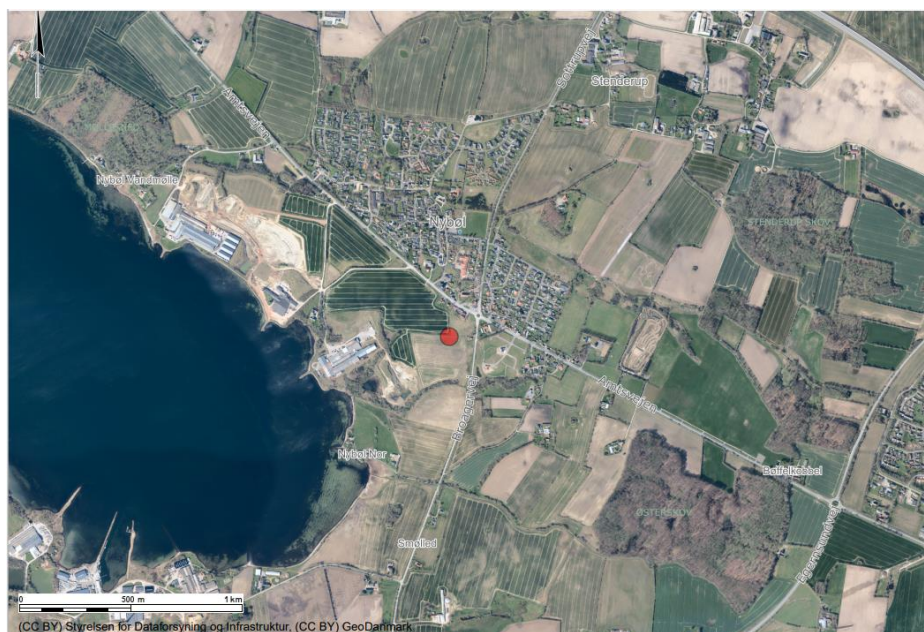
Oversigtskort som viser regnvandsbassinet's placering på matr.nr. 697 Nybøl Ejerlav, Nybøl (rød prik).

I har søgt om tilladelse til etablering af regnvandsbassin, på matr.nr. 697 Nybøl Ejerlav, Nybøl.