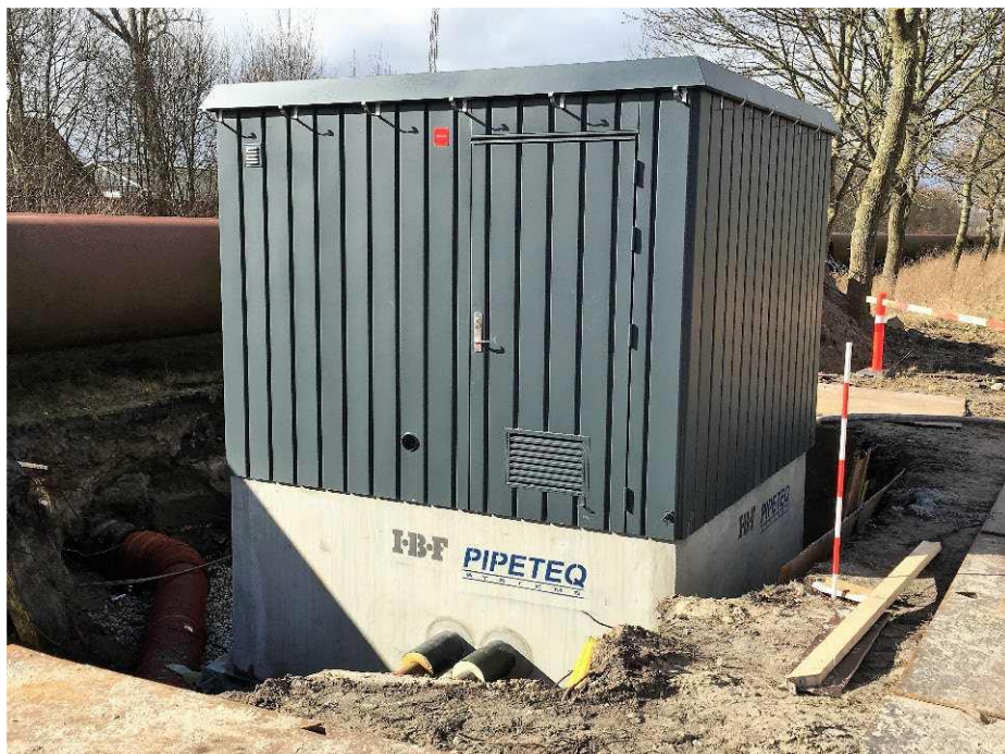
Foto som viser eksempel på shuntstation.